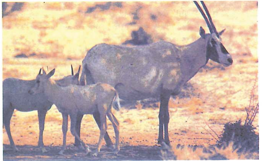
انثى المها مع صغارها

وكان من أهم مشروعات الهيئة في مرحلة تأسيسها الاولى انشاء المركز الوطنى لأبحاث الحياة الفطرية بالطائف - وحظيت طيور الحبارى لاهميتها التقليدية في المملكة بالاضافة إلى تدهور اعدادها سواء في المملكة أو خارجها باهتمام هذا المركز - وسوف يكون في المملكة اول برنامج في العالم لاجراء التجارب حول التفقيس والتفريخ لهذا الطائر ، ولقد تم الاتفاق مع الاجهزة الحكومية في البلدان التى جمع فيها البيض لهذه التجارب فهناك اتفاقية مع الجزائر وأخرى مع باكستان وغيرها ولايمت الاتفاق فقط مع