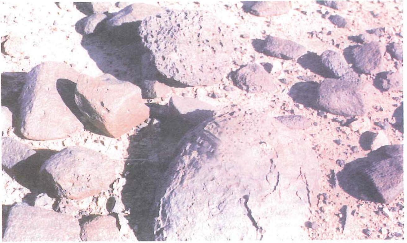
بعض الصخور البركانية من نوع البازلت الالوفيني

وذلك بحفر الآبار وسحب مياهها بسرعة دون الانتظار حتى تتعوض المياه المسحوبة وتعود إلى مستواها الطبيعي .