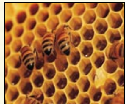
◀ شمع نحل على هيئة خلايا سداسية.

وقد أدهشت الهندسة الدقيقة التي تبني بها الشغالات العيون السداسية الكثير من العلماء على مر العصور، فالمقاييس الرياضية التي تستخدمها الشغالات في بناء جدر تلك العيون تعتبر من المعجزات، فسبحان العلي القدير الذي أوحى لهذه الحشرة الصغيرة وعلمها وأرشدتها، حيث أنها تختار الشكل