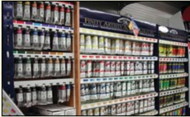
◀ شمع النحل يدخل في تصنيع الدهانات والألوان.

السداسي من بين مختلف الأشكال، حيث أنه لا يترك مسافات بين العيون السداسية بعضها البعض، كما أن الله ألهمها بأن تصمم العين بما يتفق مع هذا الغرض. فإذا كانت تبني