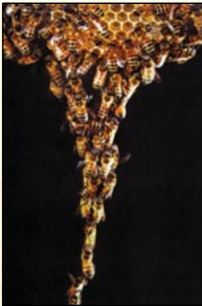
< تشابك النحل أثناء إنتاج الشمع

تستغرق العملية المذكورة عدة دقائق بعدها تقوم الشغالات بتثبيت الأقراص في أماكن متفرقة - أشجار أو بيوت الخ - وتثبيتها جيداً من أعلى بينما تبقى أجزاءها السفلية حرة دون تثبيت .