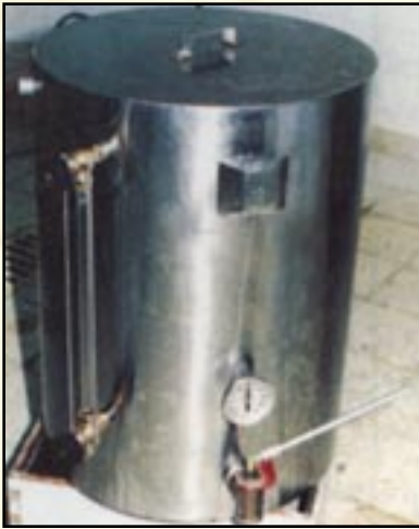
◀ الغلاية المزدوجة

طلاء الأسطح الداخلية باللون الأسود لإمتصاص أكبر قدر من الحرارة . كذلك يجب التأكد من عدم وجود شروخ أو فجوات في صندوق الفراز حتى لا يركد به الشمع المنصهر .