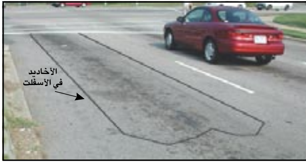
● شكل (٢) الأخاديد في الأسفلت لوضع ملف حساس الإشارة الضوئية .

النظام التقليدي الذي يؤدي إلى ضياع الوقت هدرًا. يوضع هذا الحساس عادة في الطريق الفرعي، حيث يقوم بقياس التيارات الحثية للملف في الطريق بشكل مستمر، وعندما تزيد تلك التيارات فإن